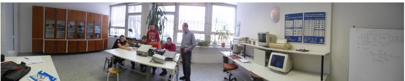
laboratórium CISCO, jazykové laboratórium, laboratóriá elektrotechnických meraní